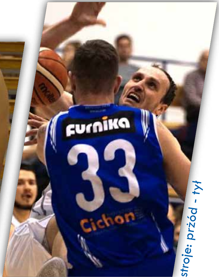
stroje: przód - tył